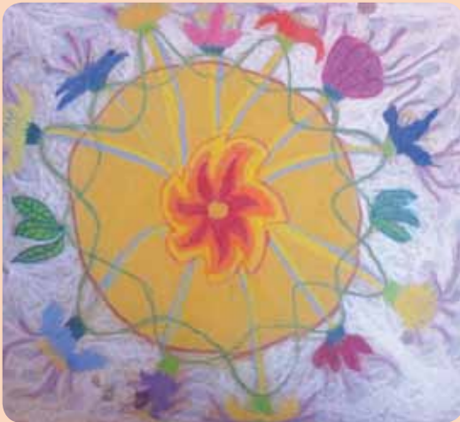
Magyarné Oszetczki Zsuzsa rajza