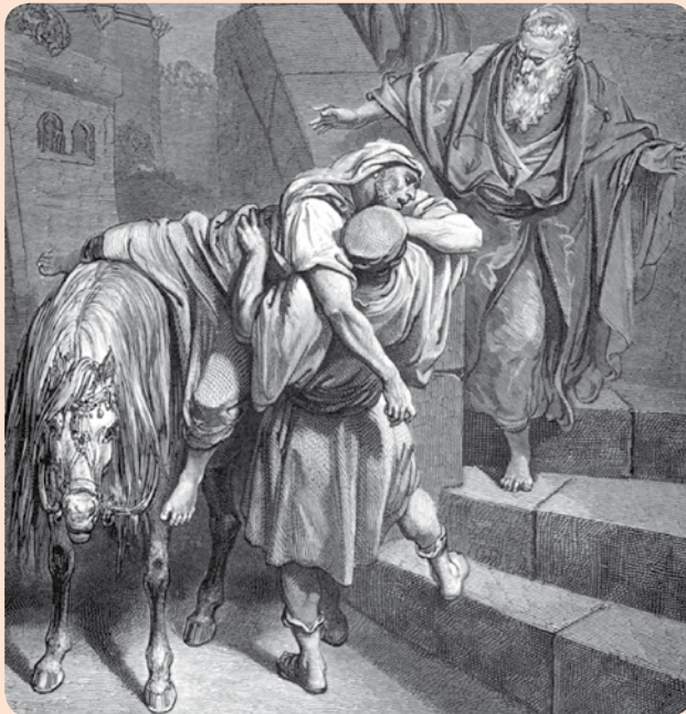
Az irgalmas samaritanus – Lk.10,25-37 (Doré, 1872)