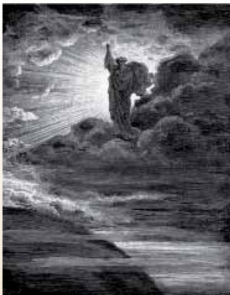
A világosság teremtése – 1Móz 1,3 (Doré, 1866)

Ez másképpen azt jelenti, hogy „amíg nappal van”, addig cselekedjük a jót, „mert eljön az éjszaka, amikor senki sem munkálkodhat” (Jn 9,4).